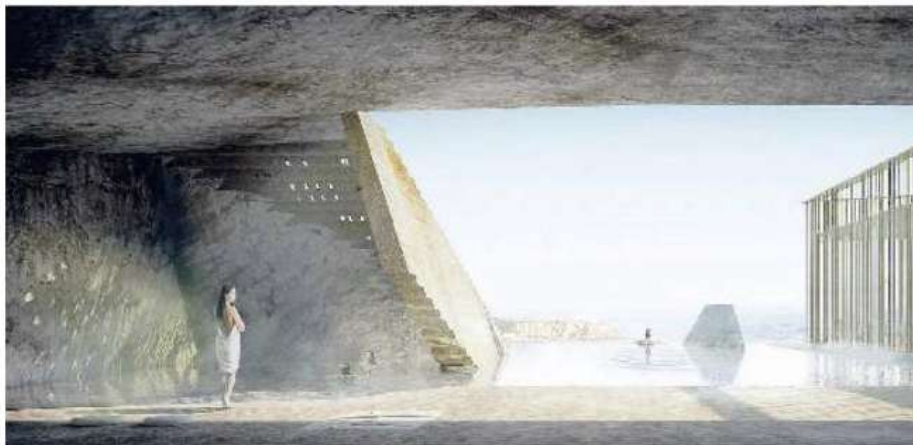
Ecco come è stato pensato il piano al livello del mare

►Previsti anche un restauro botanico e una residenza turistica nella scuola