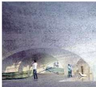
Uno scorcio del progetto