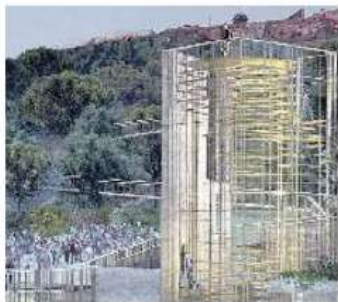
La torre alta 12,5 metri